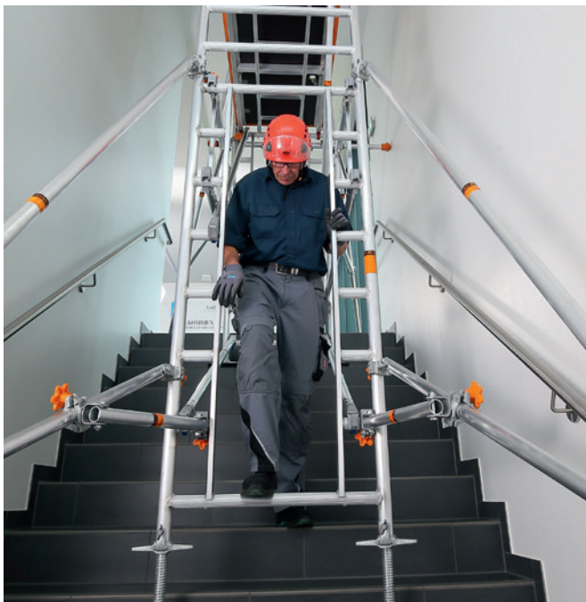
Uni Leicht mit Treppen-Kit – baustellentaugliche Durchgangswege

Das Treppen-Kit für das Uni Leicht ermöglicht den sicheren und flexiblen Einsatz von Fahrgerüstteilen in Treppenhäusern: Es bedarf keiner Umbauarbeiten, da die Treppe trotz Gerüst weiter begehbar bleibt. Durch die Erweiterung der standardmäßigen Gerüsttypen mit wenigen Einzelbauteilen bietet das Treppen-Kit in Kombination mit dem Uni Leicht eine wirtschaftlich clevere, schnelle und sichere Lösung für das Arbeiten in der Höhe – auch als Alternative zu Sprossenleitern, welche aufgrund der aktuellen Vorschriften zur Arbeitssicherheit nur noch bedingt einsetzbar sind. Nach der Montage der Basis auf den Treppenstufen kann der Aufbau der benötigten Gerüstebenen mit dem bereits bewährten Sicherheitsaufbau P2 ausgeführt werden.