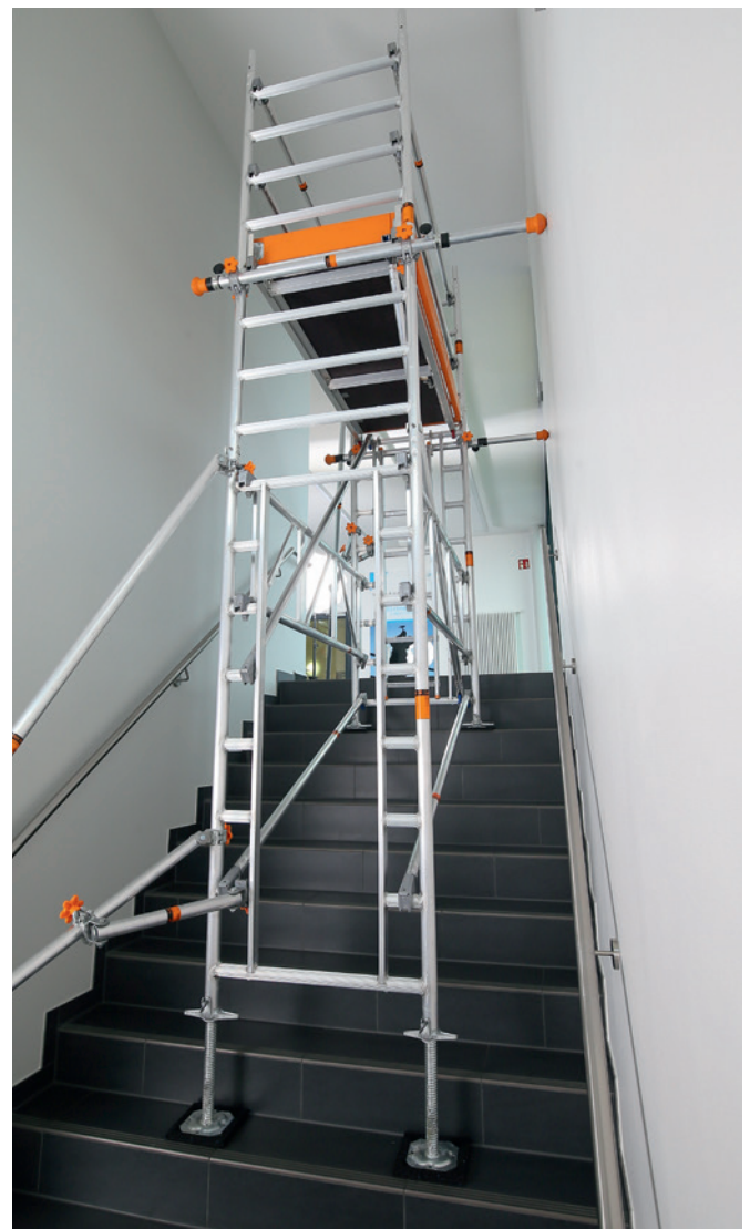
Uni Leicht mit Treppen-Kit Lösung